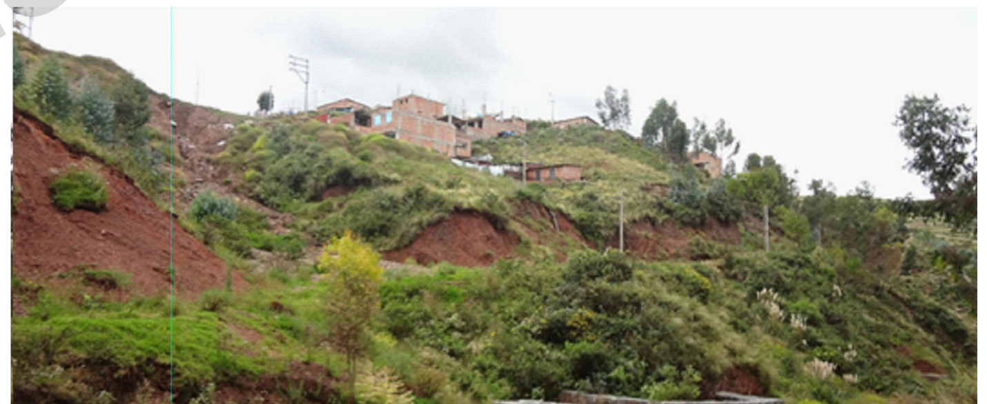
Edificaciones sobre depósitos de relleno con una muy alta probabilidad de manifestarse un deslizamiento en el ámbito de estudio de la ZRECU01.